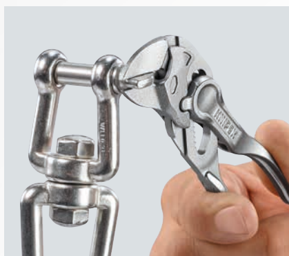
Díky velké páce a zpřevodování může Klešťový klíč XS všechno pevně sevít, stisknout nebo držet.