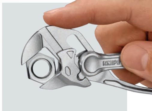
I přes svou malou velikost udrží Klešťový klíč XS matice a rovnoběžné pracovní díly do 21 mm bezpečně a jemně.